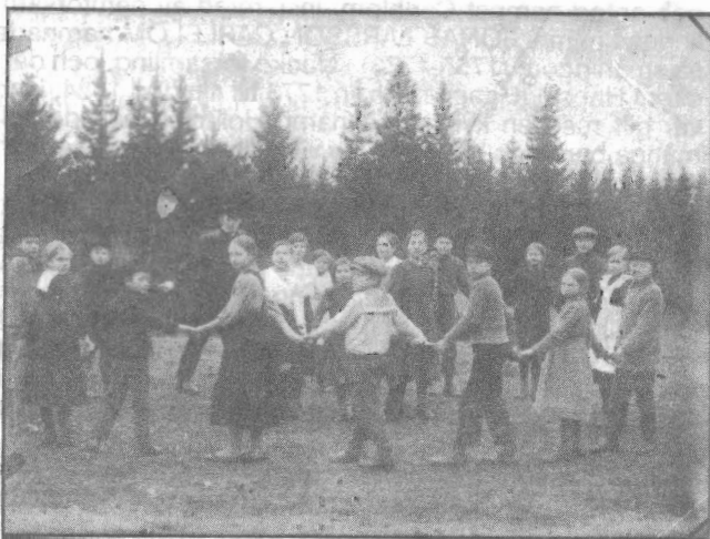
Koolilapsed ringmängus Ugla külas Iiskase talus 1920.a. Skolbarn i ringlek i Ugla by Iisaks gård år 1920.